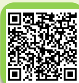
ประกาศกระทรวงอุตสาหกรรม (ฉบับที่ 2) พ.ศ. 2566