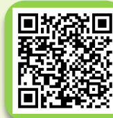
คู่มือการรายงานข้อมูล