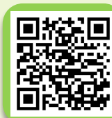
การรายงานข้อมูล (ระบบ I-Single form)